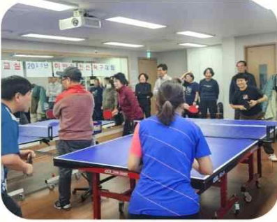
12/6, 수다 하반기 탁구대회

7월에 이어 올해 두번째 탁구대회! 수, 목, 토 수다 탁구교실에 참여하는 주민들이 한자리에~ 실력도 뽐내고 친분도 다지는 시간~