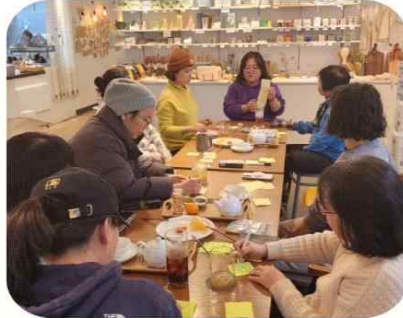
12/13, 임직원 워크숍

7월에 이어 올해 두번째 탁구대회! 수, 목, 토 수다 탁구교실에 참여하는 주민들이 한자리에~ 실력도 뽐내고 친분도 다지는 시간~