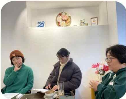
12/27 은빛 워크숍(2차)

동네 어르신들이 연말을 좀 더 따뜻하고 즐겁게 보내시길 바라며 두루두루배움터와 공동주최했어요. 동지팔죽, 공동체영화상영, 노래자랑까지~