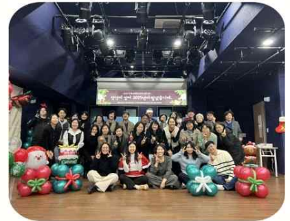
12/23, 강북교육복지센터 땡큐데이

춘향전을 노래극으로 표현한 공연이었어요. 1회 공연으로 끝내긴 너무 아까운 열정 가득한 시간이었어요. 유랑단~ 강북, 서울, 세계로 gogo~