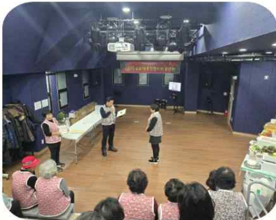
12/26, 수유1동통장협의회 송년회

올해 조합과 살뜰한 사업 연계로 가까워진 교육복지센터에서 센터 사업에 애쓴 분들을 초대해 마음 나누는 자리를 수다극장에서 가졌어요.