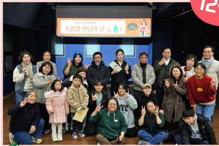
12/12 조합원 만남의 날