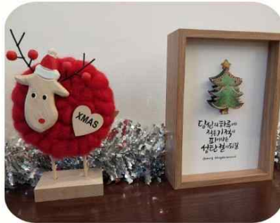
은빛 크리스마스 특별전

지난 10월에 3번째 무상사용승인을 받은 수유은빛마당의 운영 방안을 논의하는 자리를 2번째 가졌어요. 애써 시간, 마음도 토닥였어요.