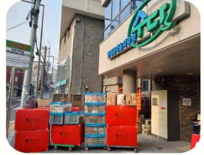
아름다운하루 기부물품 모으기

"당신의 2025년은 충분히 아름다웠어요" 평화롭고 따뜻한 분위기의 전시회가 은빛에서 열렸어요. 다음 전시도 기대해 주세요!