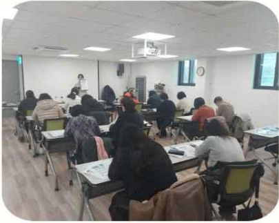
12/2, 크리스마스 카드만들기

강북구사회적경제지원센터와 협력해 주민들을 위한 크리스마스카드만들기 프로그램을 진행했어요. 센터와 우리조합 소개도 곁들였지요^^