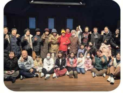
12/22, 3회 빨래골 노인문화제

올해 사업 돌아보고 서로의 기운 채워주기 위한 워크숍! 분주하게 뛰며 일한 조합 임직원님들 고생하셨어요! 내년에도 핫팅!