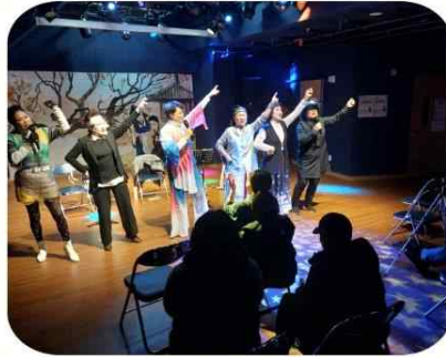
12/20, 빨래골유랑단 퓨전노래극

강북구사회적경제지원센터와 협력해 주민들을 위한 크리스마스카드만들기 프로그램을 진행했어요. 센터와 우리조합 소개도 곁들였지요^^